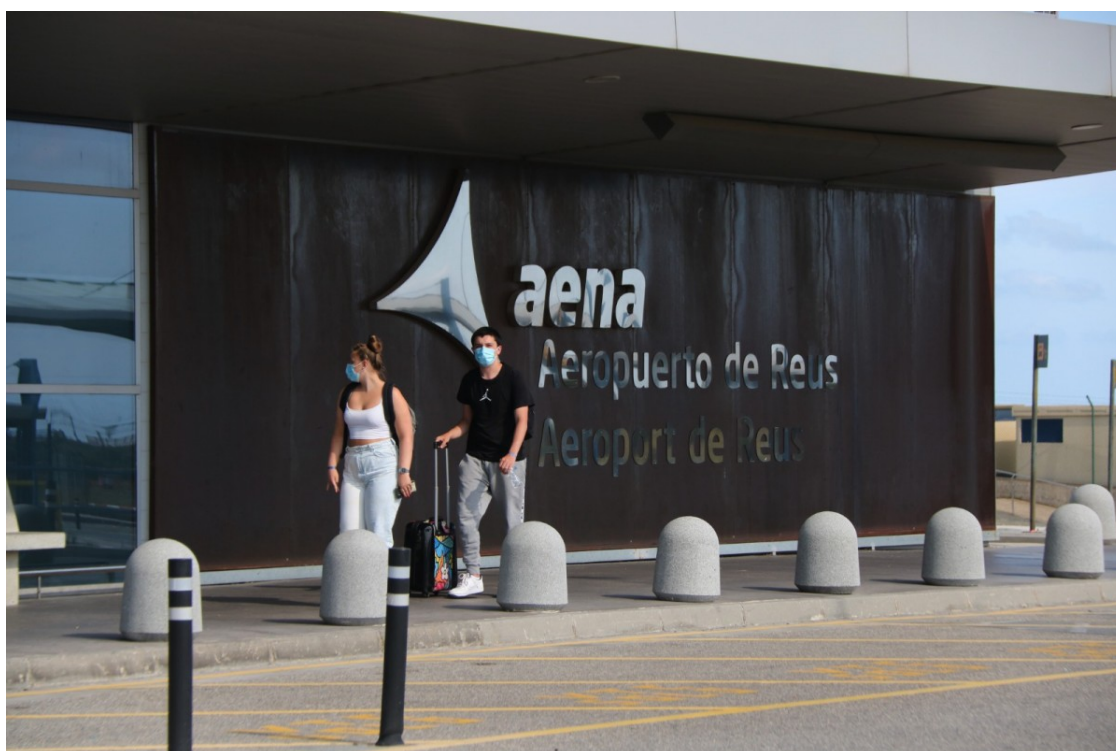
Una parella, a l'exterior de l'Aeroport de Reus

La Plataforma per a la Promoció del Transport Públic aposta per connectar la base del Baix Camp amb Girona i el Prat amb un servei regional d'alta velocitat