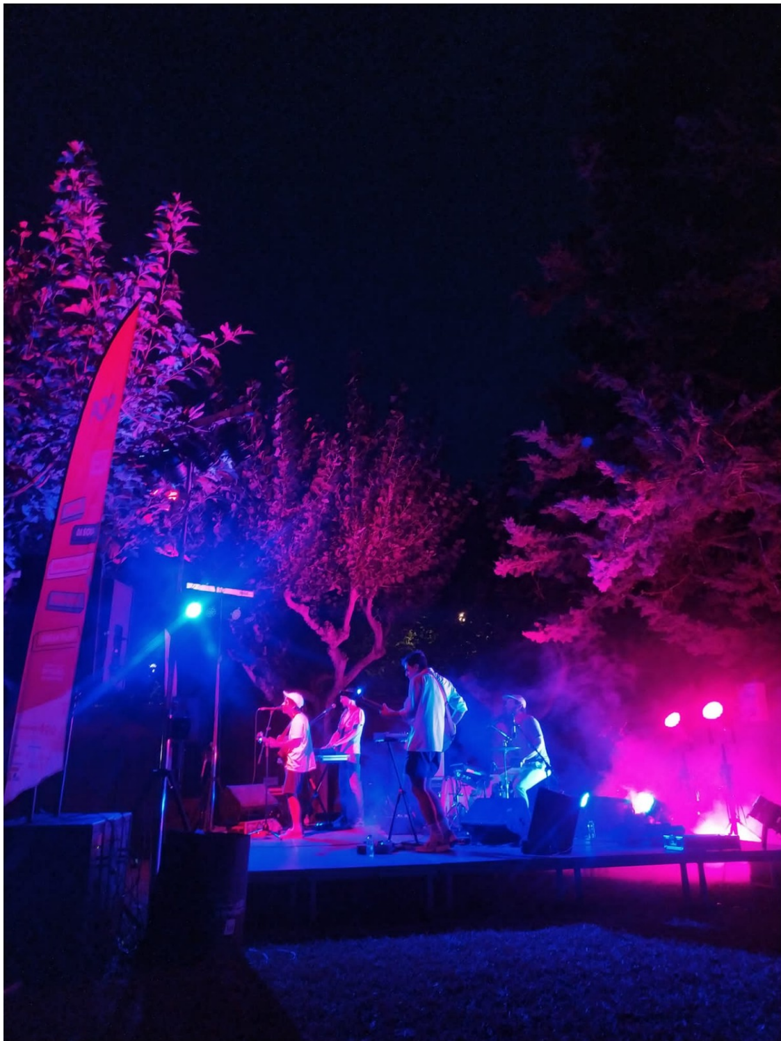
Actuació de Ferran Palau a Falset