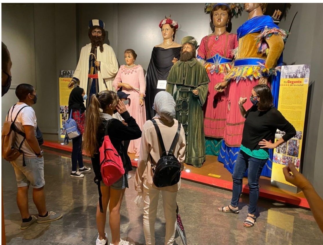
Imatge d'una visita al Museu de Reus

Tot i les restriccions per la pandèmia, s'han doblat les dades respecte del 2020