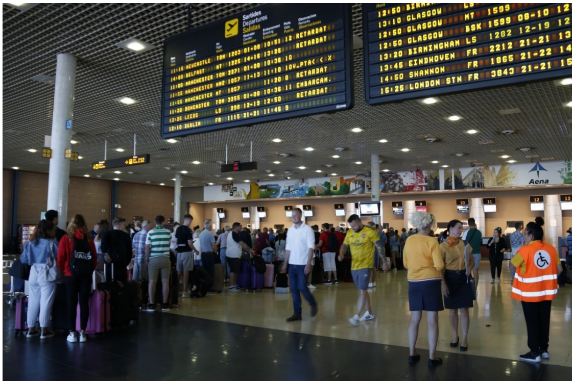
Imatge d'arxiu de l'Aeroport de Reus

L'obra suposarà una inversió de 1.700 milions d'euros i es farà afectant "el mínim possible" l'espai protegit de La Ricarda