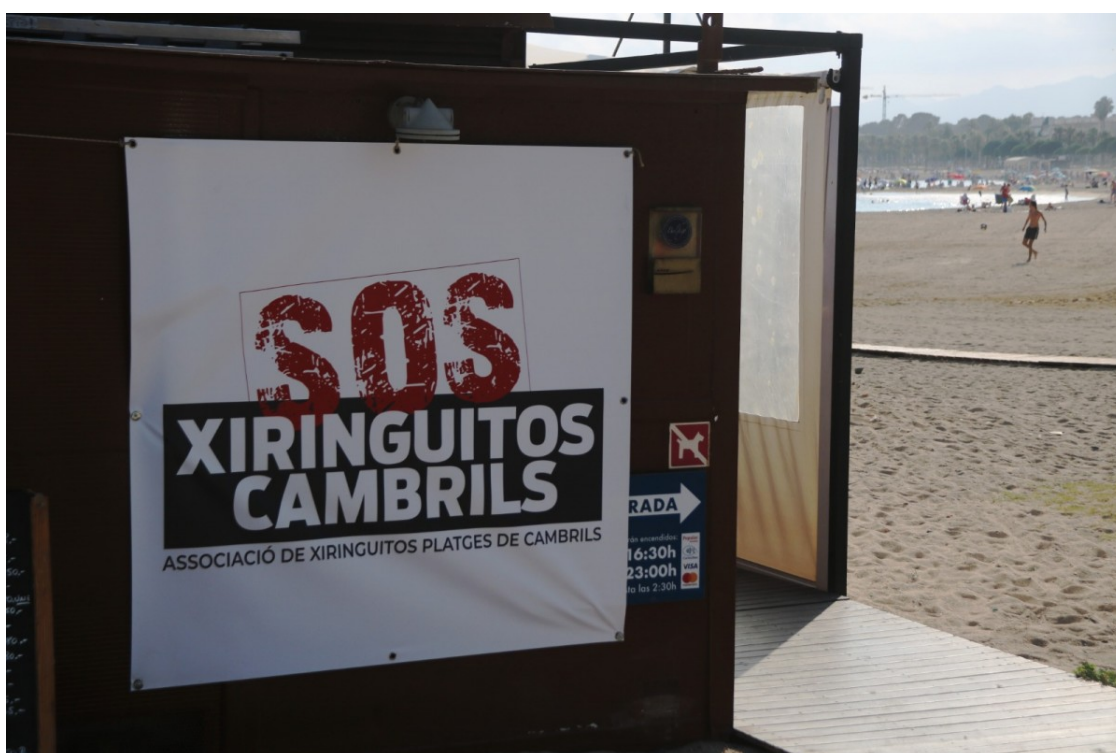
Una pancarta de l'Associació Xiringuitos Platges de Cambrils

El termini s'acabava dilluns vinent i ara s'allargarà fins el 16 d'agost