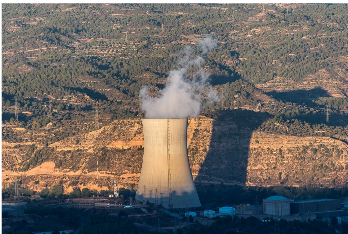
Central nuclear d'Ascó.

Ecologistes en Acció ha enviat una petició al Ministeri per a la Transició Ecològica per tal que no s'autoritze la prorrogació de la vida activa de les centrals nuclears