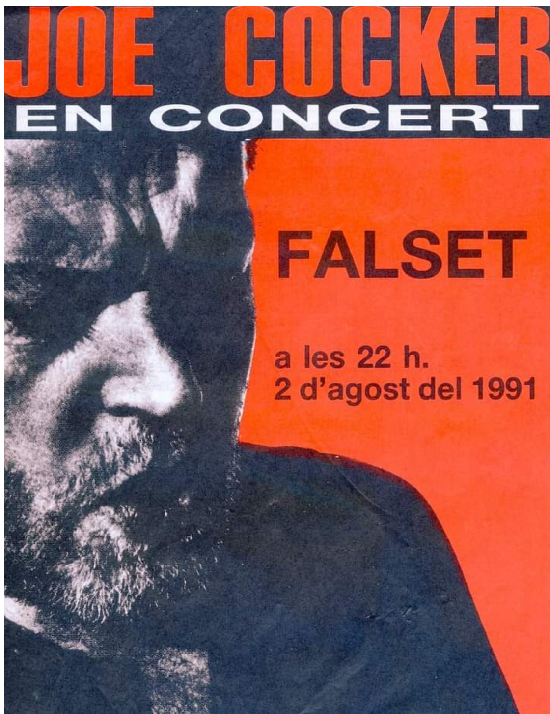
El cartell del concert