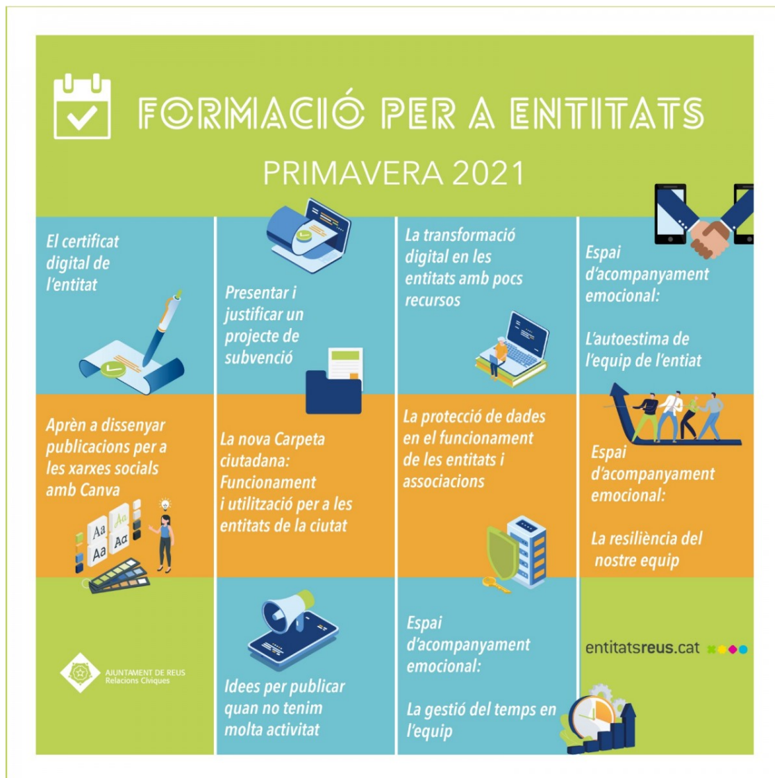
Cartell del cicle de formació de les entitats | Ajuntament de Reus

S'ha realitzat un total de 10 sessions durant els mesos d'abril, maig i juny