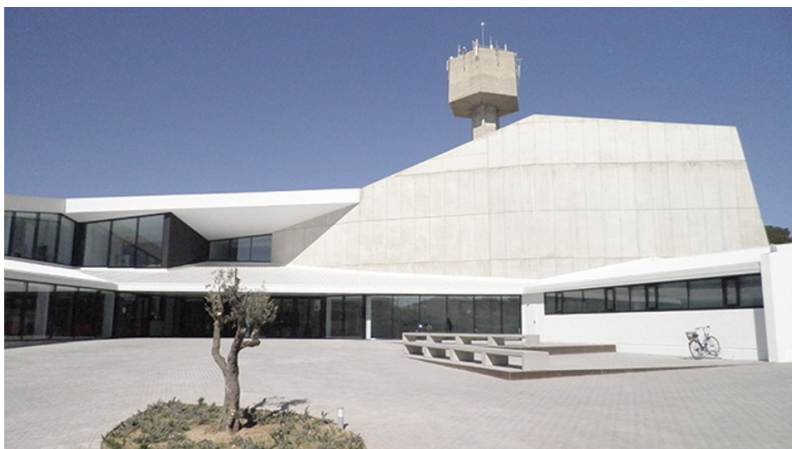
Exterior del teatre-auditori de l'Hospitalet

Hi prenen part Idetsa, ADE, la Cambra de Reus, PIMEC i el consistori