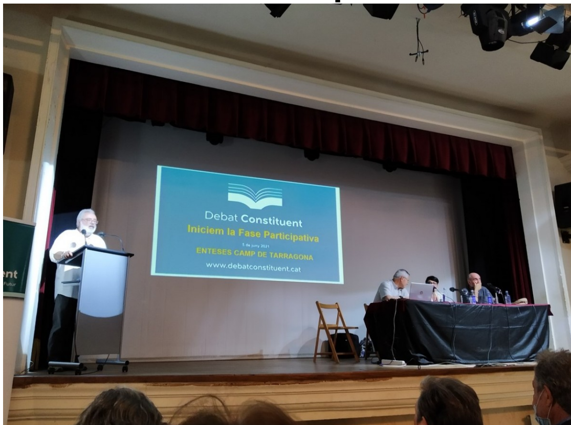
Imatge del Debat Constituent celebrat a Reus | Anton Baiges Gras

El passat dissabte es presentà al teatre de l'Orfeó Reusenc , de Reus, -a mitja capacitat-, la Fase Participativa del Debat Constituent, sorgida del Consell Assessor per a l'Impuls d'un Fòrum Cívic i Social, creat el novembre de 2018 pel Govern presidit per Quim Torra . La iniciativa pretenia i pretén crear un debat nacional, plural, inclusiu i el més transversal possible, per tal de definir uns possibles bases d'una nova Constitució política catalana.