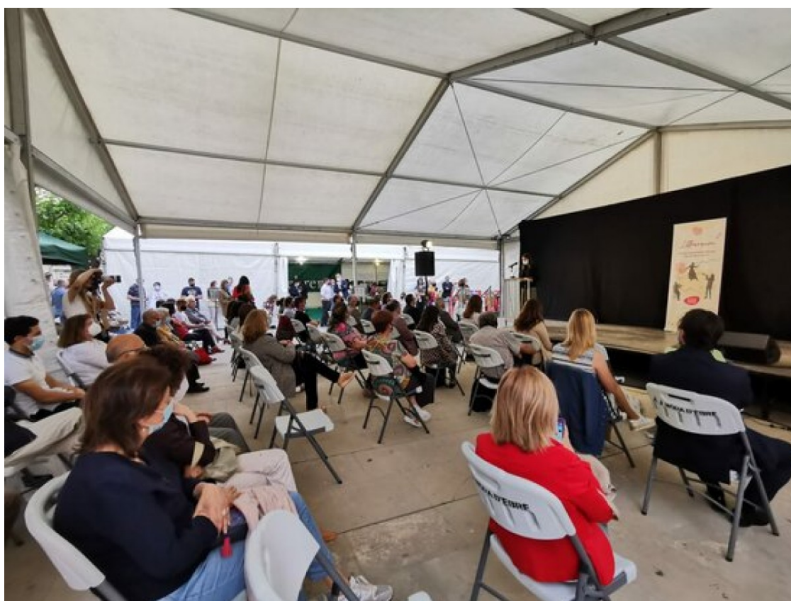
Inauguració de la mostra Litterarum

Els llibreters venen 650 exemplars en la 18a edició de la Fira del Llibre Ebrenc