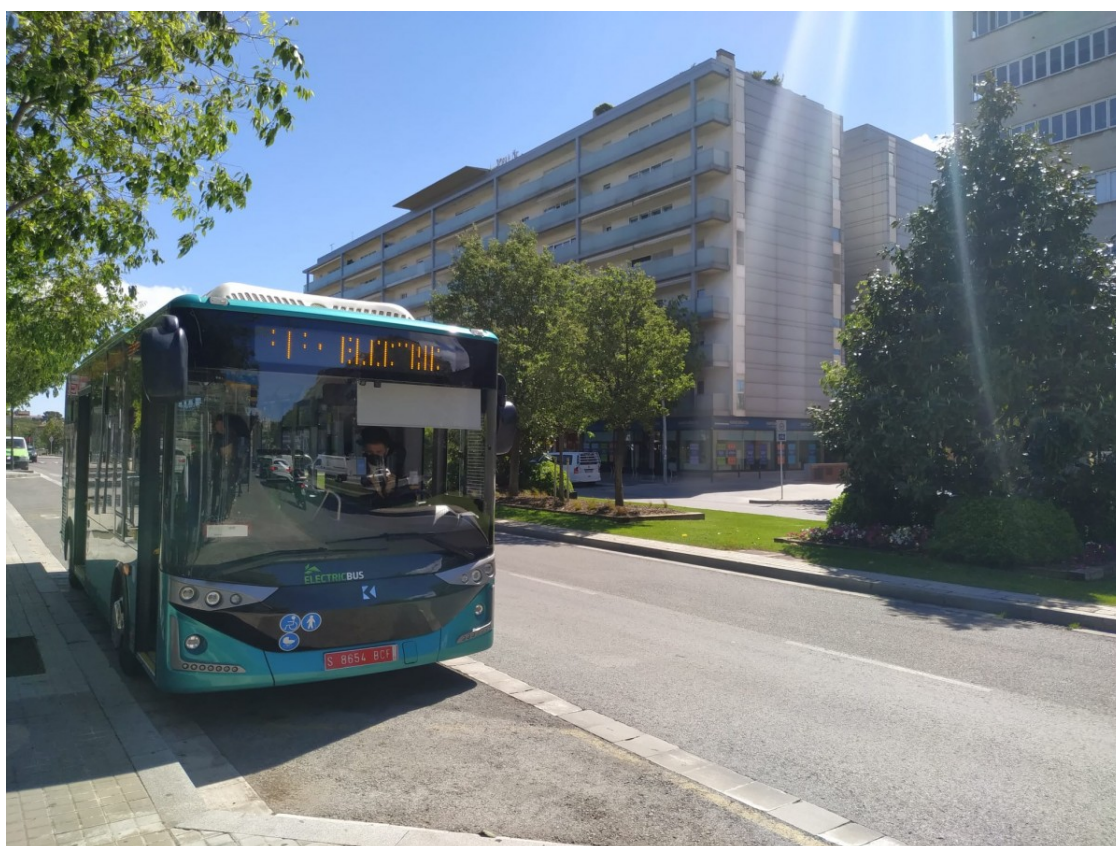
Una imatge del bus elèctric a prova

És un model 'Atak' de 8 metres de longitud i amb capacitat per a mig centenar de persones