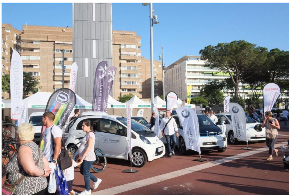
Una imatge de la fira Velèctric de 2017

Els cotxes tindran codis QR per veure'n les característiques