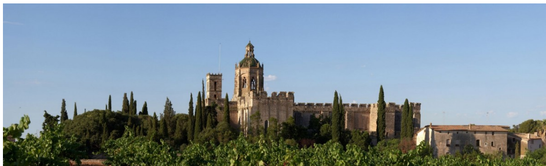
Una imatge de Santes Creus | Cedida

Us convidem a redescobrir les joies arquitectòniques i culturals que ofereix aquest territori