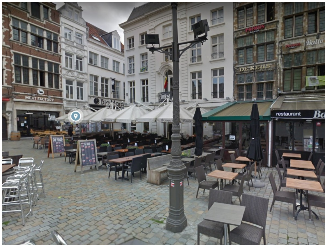
Una imatge de l'exterior del Cafe de Reus, a Anvers

Al cor d'Anvers s'hi amaga una curiositat relacionada amb la capital del Baix Camp